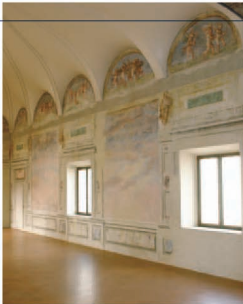
Fig. 2 Palazzo Ducale, sala dello Specchio