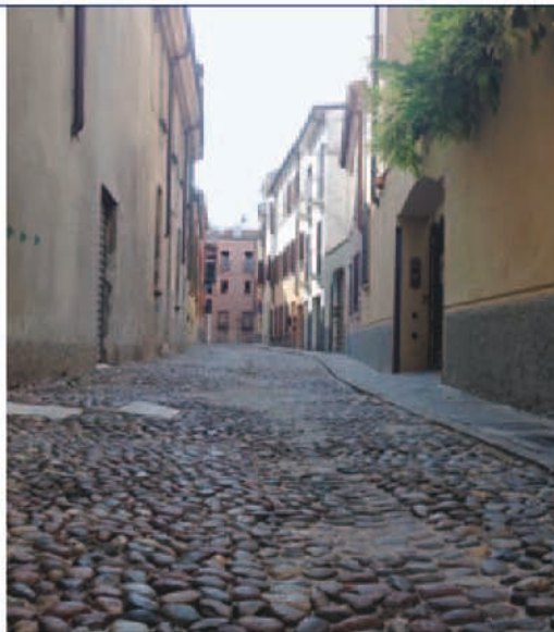
Fig. 1 Vicolo Freddo (già vicolo S. Tomaso), scorcio

A ventitré anni Claudio Monteverdi giunse a Mantova (1590 ca.), assunto come suonatore di viola e poi come cantore da Vincenzo I Gonzaga. Proveniva da Cremona, forte della scuola di Marcantonio Ingegneri e della pubblicazione di cinque raccolte. Brillante al seguito di Vincenzo I in Ungheria (1595) e nelle Fiandre (1599), dovette attendere la morte di Alessandro Striggio sr (1592), di Giaches Wert (1596), di Francesco Rovigo (1597) e di Benedetto Pallavicino (1601) per ottenere l'ambita carica di «maestro e de la Camera e de la Chiesa sopra la musica» del duca (1601). Nel periodo mantovano diede alle stampe: il Terzo (1592), il Quarto (1603) e il Quinto (1605) libro dei madrigali, gli Scherzi musicali (1607), La favola d'Orfeo (1609), La messa e i vespri della Beata Vergine (1610). Compose inoltre L'Arianna e il Ballo delle Ingrate (feste 1608) e altri brani irreperibili o editi in seguito. Difese poi le proprie scelte dichiarandosi, negli avvertimenti inclusi nel Quinto libro e negli Scherzi musicali , creatore di una «seconda pratica» compositiva, mossa dalla ricerca del senso profondo della poesia ( oratione ) e degli affetti. A Mantova egli costruì la propria vita di uomo. Il 20 marzo 1599 sposò nella [1] chiesa dei Santi Simone e Giuda (via Domenico Fernelli) la figlia di un collega violista, la cantante di corte Claudia