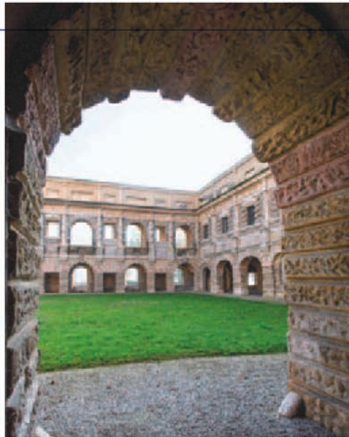
Fig. 3 Palazzo Ducale, cortile della Cavallerizza