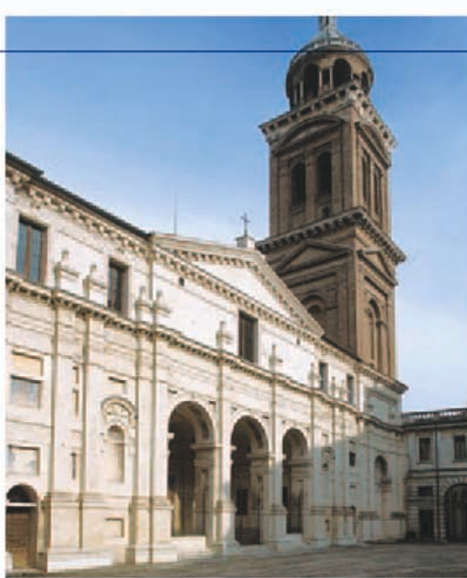
Fig. 4 Basilica palatina di S. Barbara

musiche 'rappresentative', tra cui: madrigali per la pastorale di Guarini Pastor Fido (1598, 1600); il balletto Endimione per la commedia Acessi de amor , recitata dai comici ebrei (1605); forse una replica di La favola d'Orfeo (1607); e, dopo il licenziamento, gli intermedii per la commedia Le tre costanti (1621) di Ercole Marliani. Nel teatro Grande, la disposizione degli strumenti si adattava alle esigenze drammaturgiche: nel Ballo delle Ingrate furono, per esempio, collocati a vista su una loggia laterale posta fra il palcoscenico e il pubblico. In corte esisteva (dal 1594?) anche un [5] «teatro Piccolo» (Fig. 5) collocato in fondo all'attuale via Teatro Vecchio, nell'area ora occupata dal Museo dei Vigili del fuoco: vi risuonarono certo sue composizioni, al momento tuttavia non