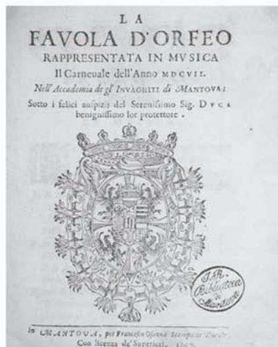
Fig. 6 La favola d'Orfeo , libretto (Bibl. Teresiana)