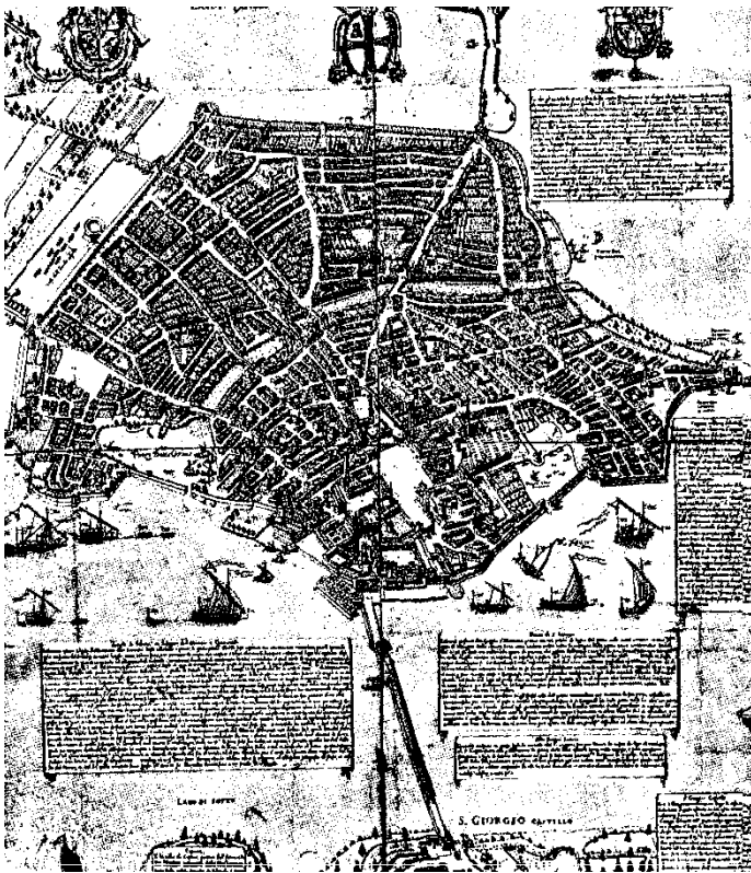
"Urbis Mantua Descriptio" (Bertazzolo 1628)