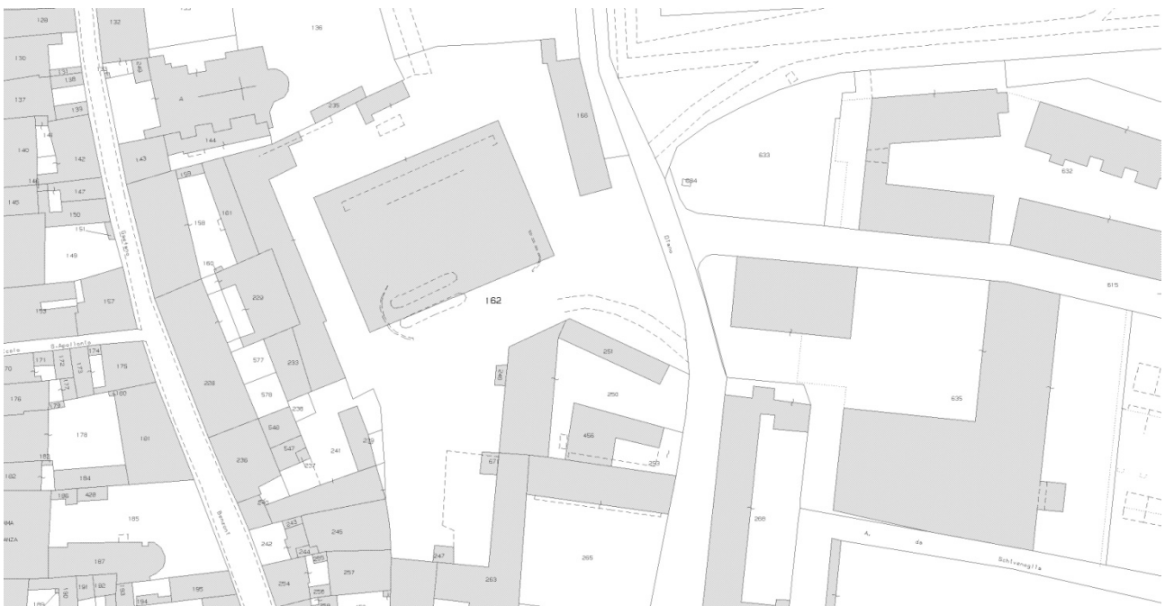
Estratto della mappa catastale

Come già accennato il progetto urbanistico e di recupero edilizio che caratterizza il Piano si lega alla riqualificazione in atto nel quartiere, che attraverso gli interventi in fase di realizzazione definiti all'interno del progetto Mantova Hub quali la nuova scuola in fase di avanzata realizzazione e gli interventi dell'area di San Niccolò, si sta trasformando in un'area urbana ad elevata qualità edilizia con servizi di natura pubblica tesi al soddisfacimento dei bisogni dell'intera comunità.