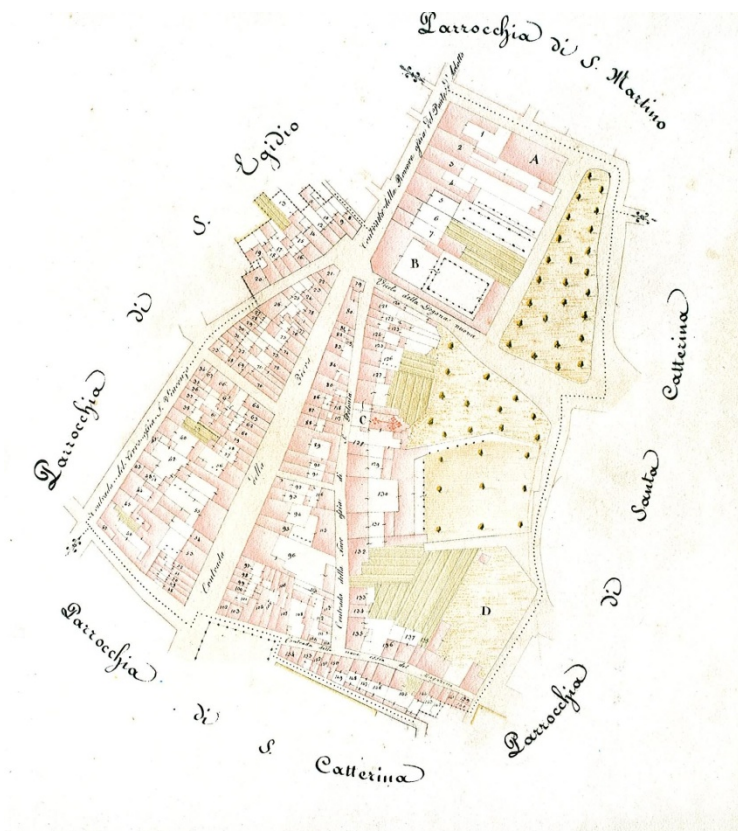
Parrocchia urbana di Santa Apollonia