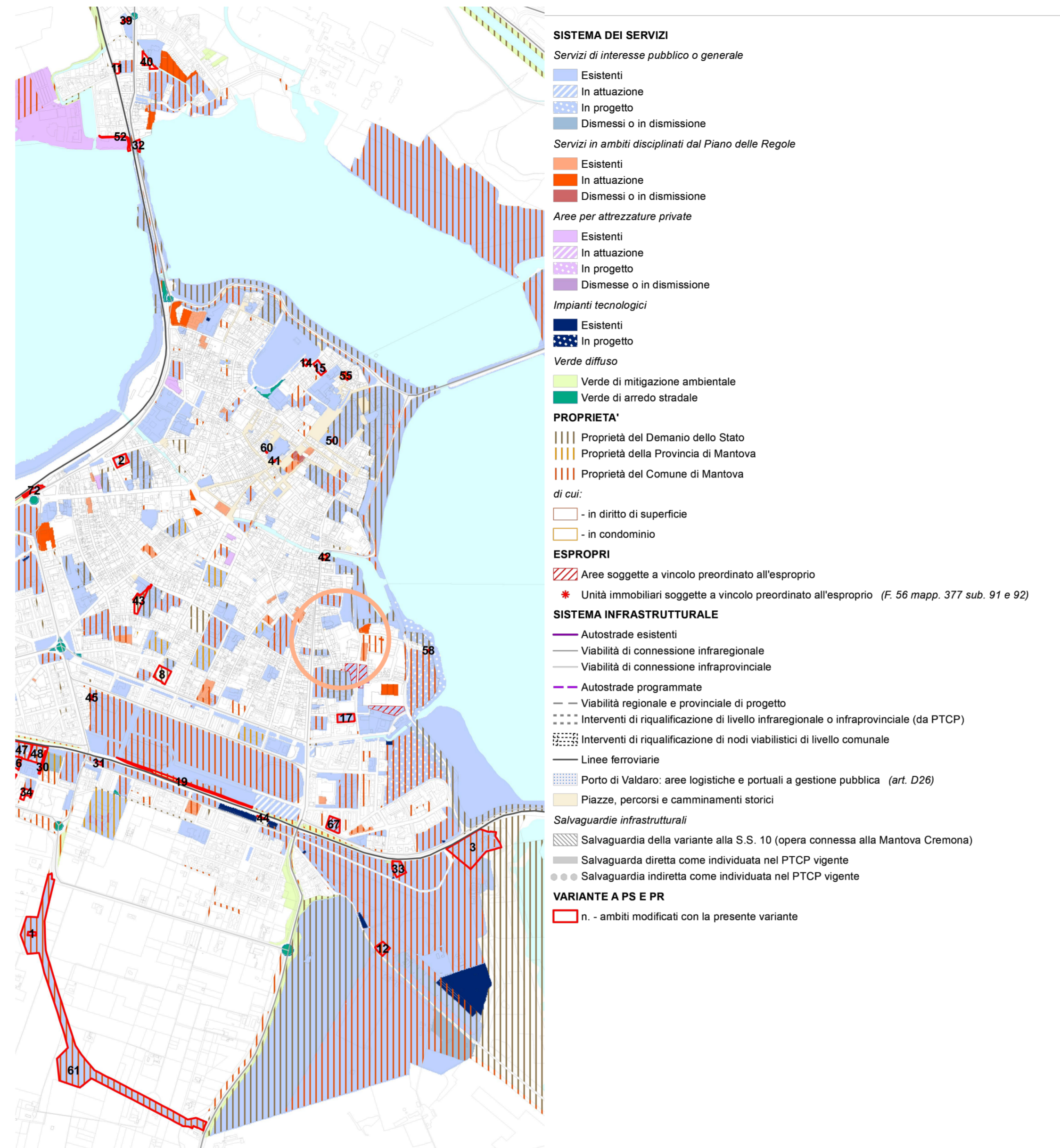
ESTRATTO P.G.T. COMUNE DI MANTOVA - Piano dei Servizi tavola PS1 - Aree per attrezzature pubbliche e di interesse pubblico o generale - Variante PS e PR